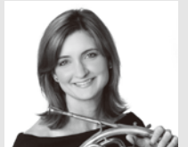
ジュリア・バイラント メトロポリタン歌劇管弦楽団・副首席ホルン奏者