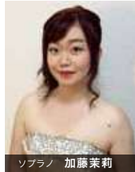
ソプラノ 加藤茉莉