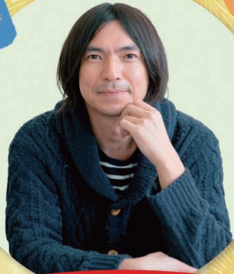
ふかわりょう (うたたねナビゲーター)

NHK-FMのクラシック番組「きらクラ!」で 長年パーソナリティを務めた、タレントのふかわりょうと チェリストの遠藤真理の名コンビが演奏家仲間たちと贈る、 リラックスして楽しめるバラエティコンサート